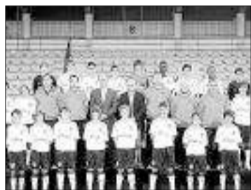
Valencia CF infantil A.

El FBM Moncada CF es el anfitrión de una nueva edición del torneo Miguel Tendillo de fútbol base una competición de reconocido prestigio que año tras año reúne en el Polideportivo La Pelosa a algunos de los jóvenes valores del fútbol base valenciano y nacional. Valencia CF, Levante UD, Catarroja y Málaga junto al Marítim femenino, tratarán de ofrecer un gran espectáculo.