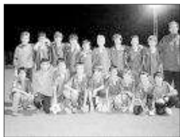
Levante Infantil C.