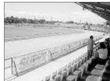
El torneo se juega en La Pelosa. SD

El Málaga CF cierra el cartel del torneo. Es la escuela del fútbol andaluz que más ha progresado en los últimos años paralelamente al crecimiento del primer equipo.