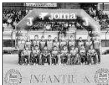
Catarroja Infantil A.